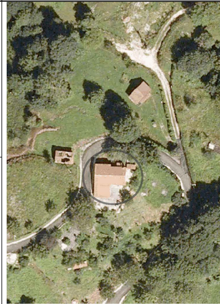
Plan Nacional de Ortofotografía Aérea ( PNOA 2007 ). E:1/1000