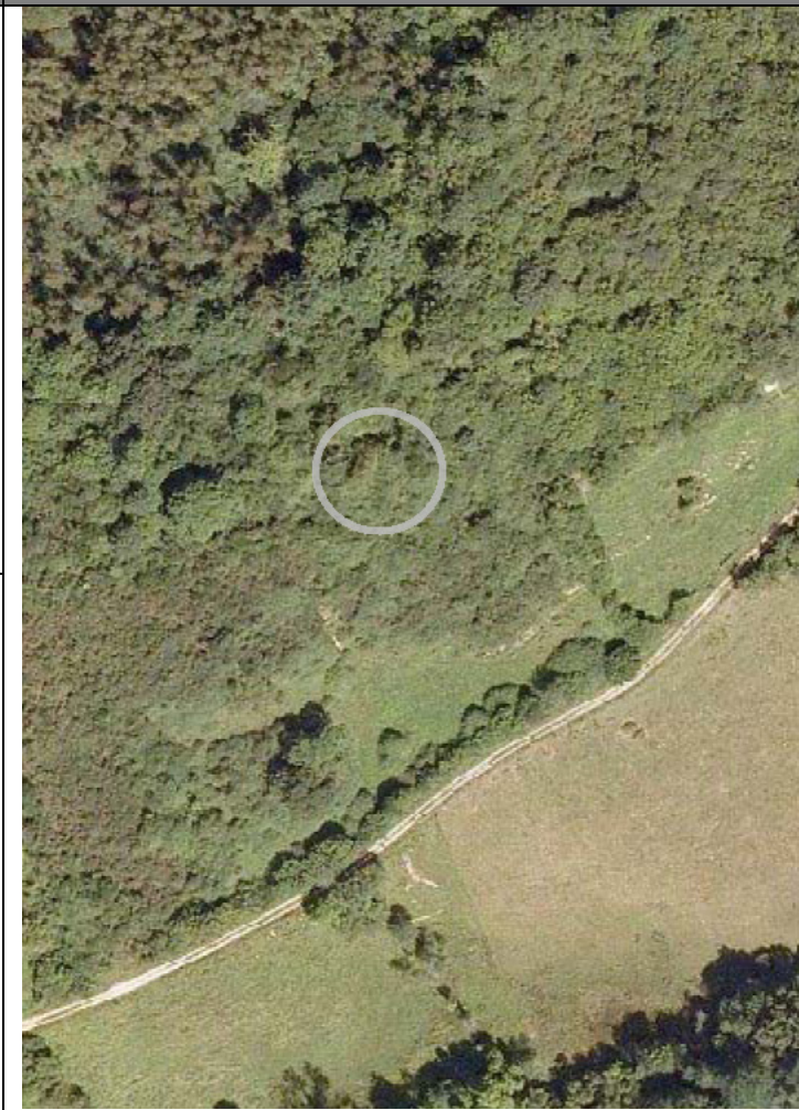
Plan Nacional de Ortofotografía Aérea ( PNOA 2007 ). E:1/2000