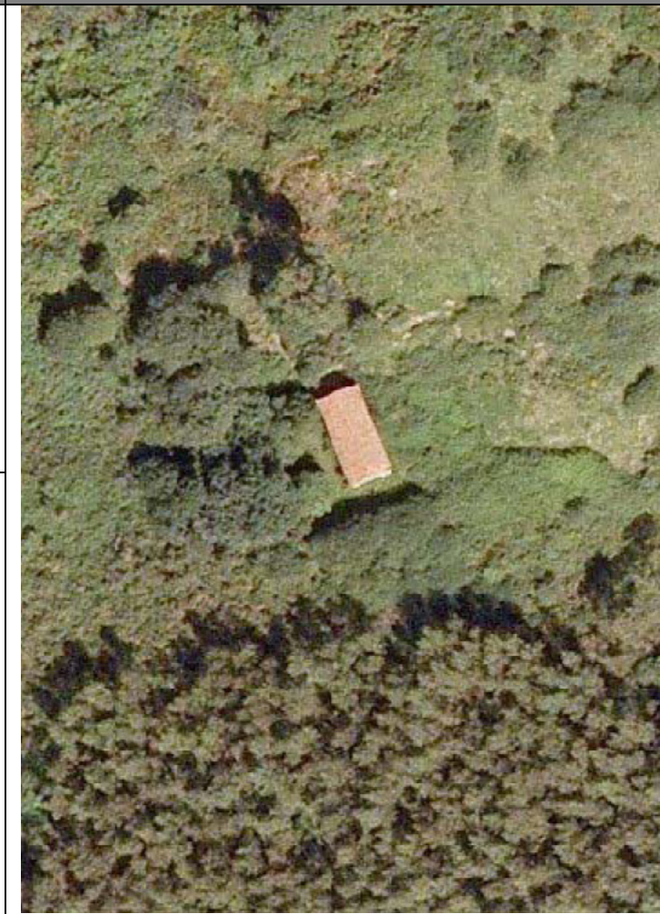
Plan Nacional de Ortofotografía Aérea ( PNOA 2007 ). E:1/2000