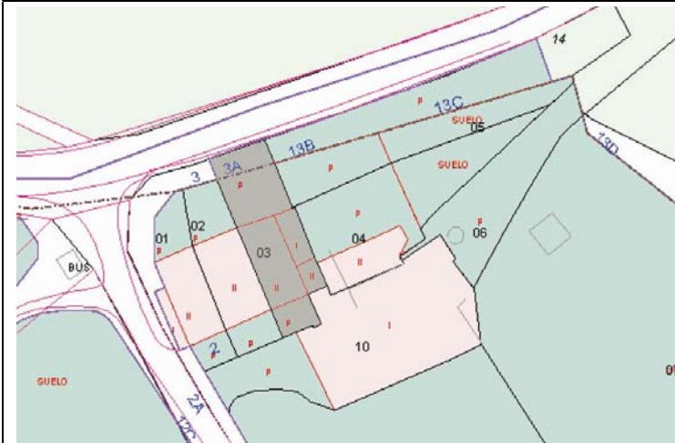
Plano de Catastro (Junio2010). E: 1/1000