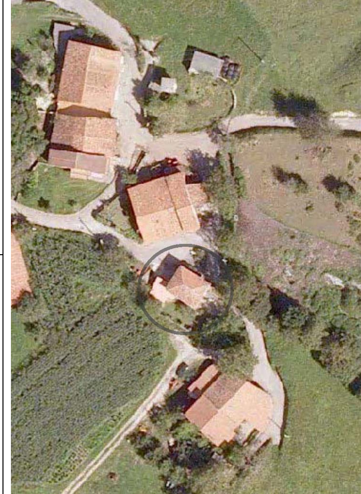
Plan Nacional de Ortofotografía Aérea (PNOA 2007). E:1/1000