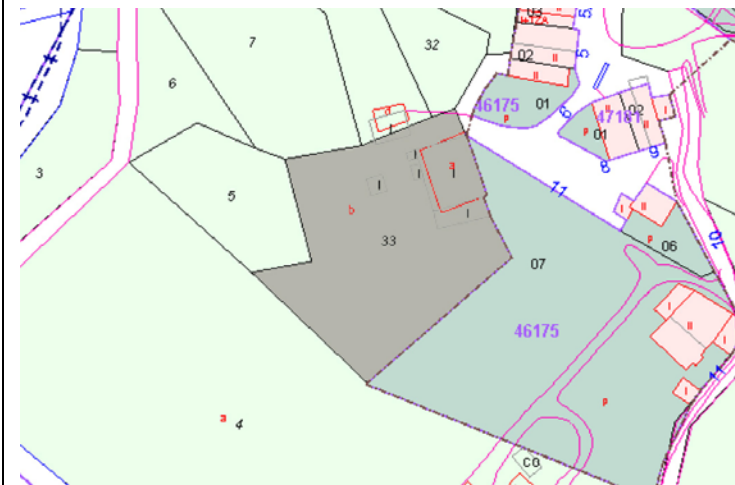
Plano de Catastro (Junio2010). E: 1/2000