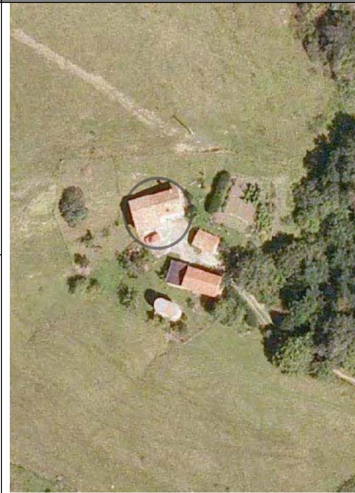
Plan Nacional de Ortofotografía Aérea ( PNOA 2007 ). E:1/1000