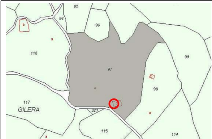
Plano de Catastro (Junio2010). E: 1/5000