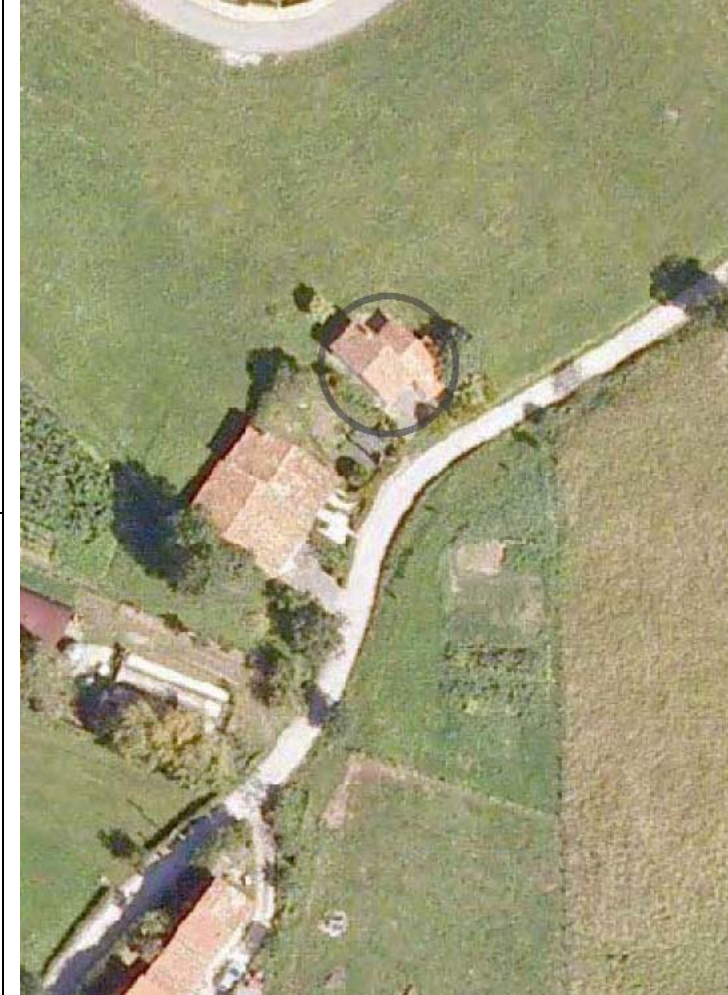
Plan Nacional de Ortofotografía Aérea (PNOA 2007). E:1/1000