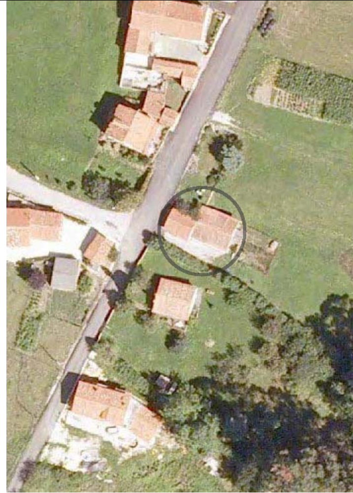
Plan Nacional de Ortofotografía Aérea ( PNOA 2007 ). E:1/1000