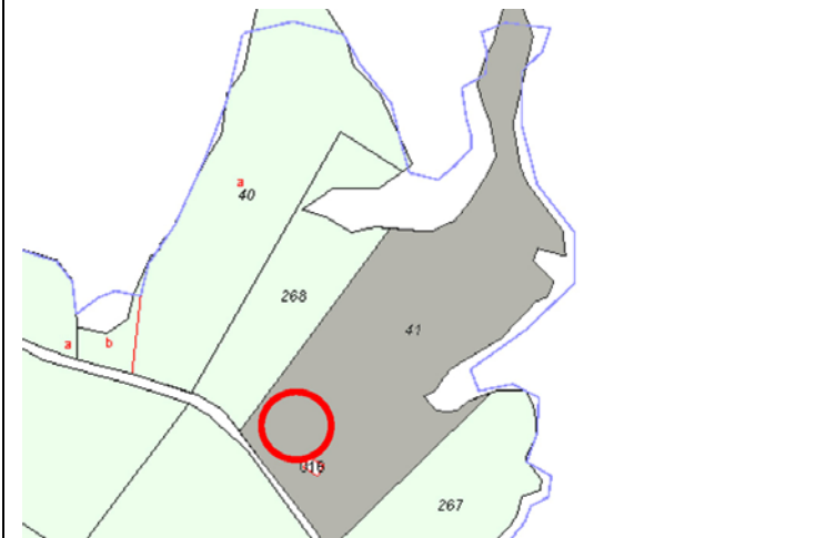
Plano de Catastro (Junio2010). E: 1/5000