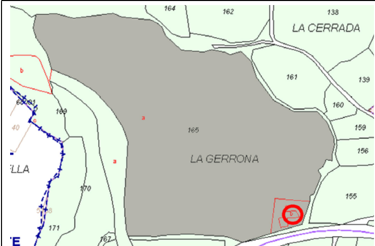
Plano de Catastro (Junio2010). E: 1/6000