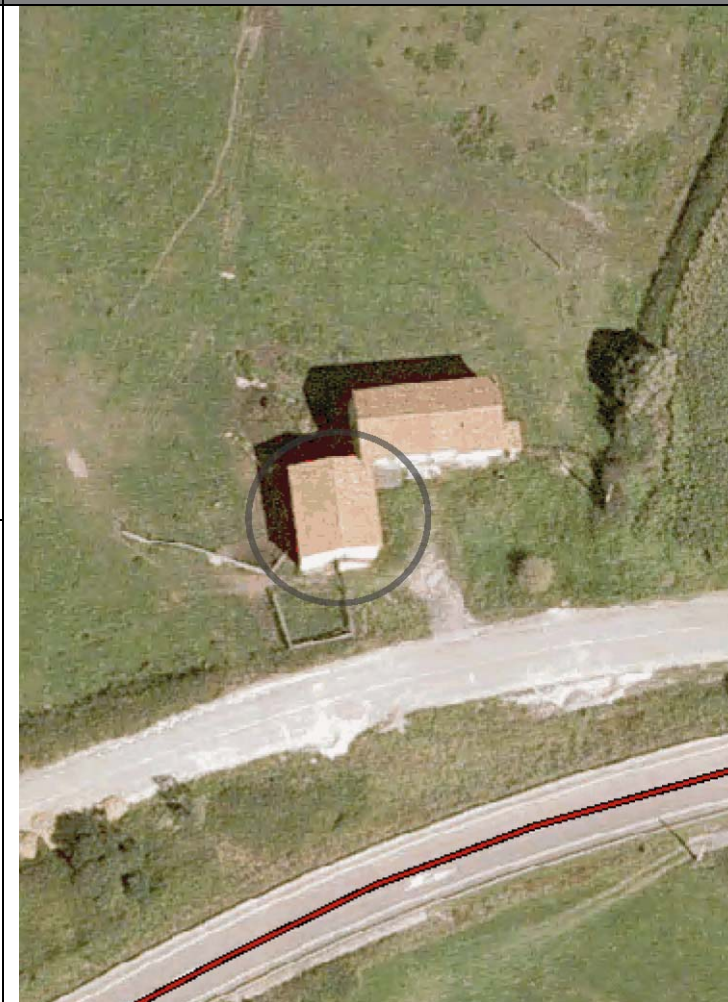
Plan Nacional de Ortofotografía Aérea ( PNOA 2007 ). E:1/1000