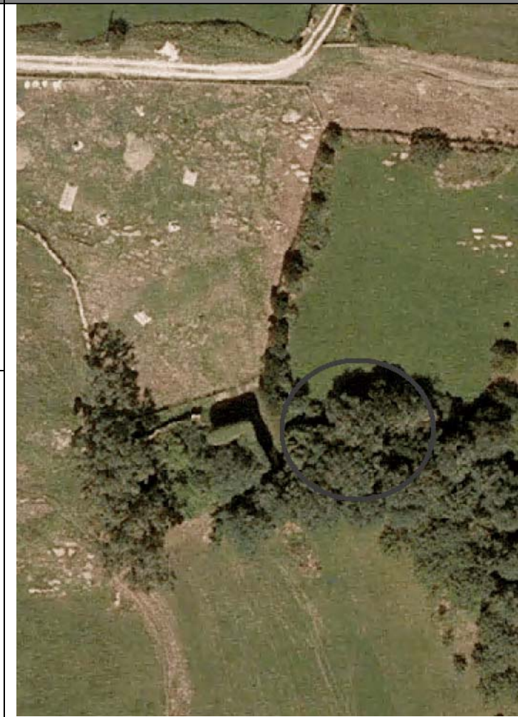
Plan Nacional de Ortofotografía Aérea ( PNOA 2007 ). E:1/1000