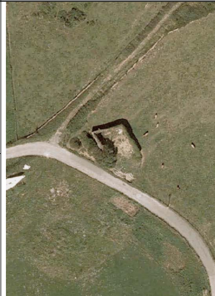
Plan Nacional de Ortofotografía Aérea ( PNOA 2007 ). E:1/1000