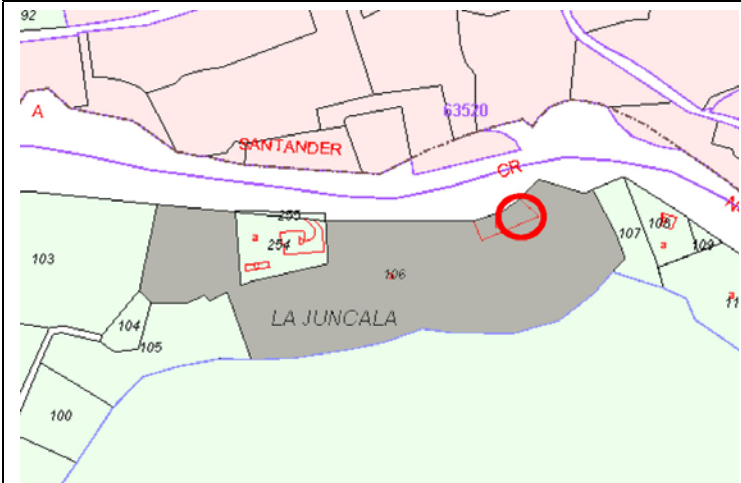
Plano de Catastro (Junio 2010). E: 1/5000