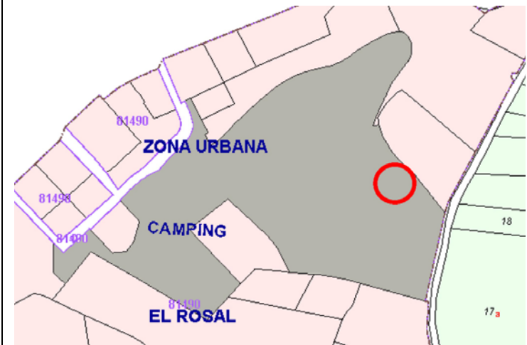
Plano de Catastro (Junio2010). E: 1/5000