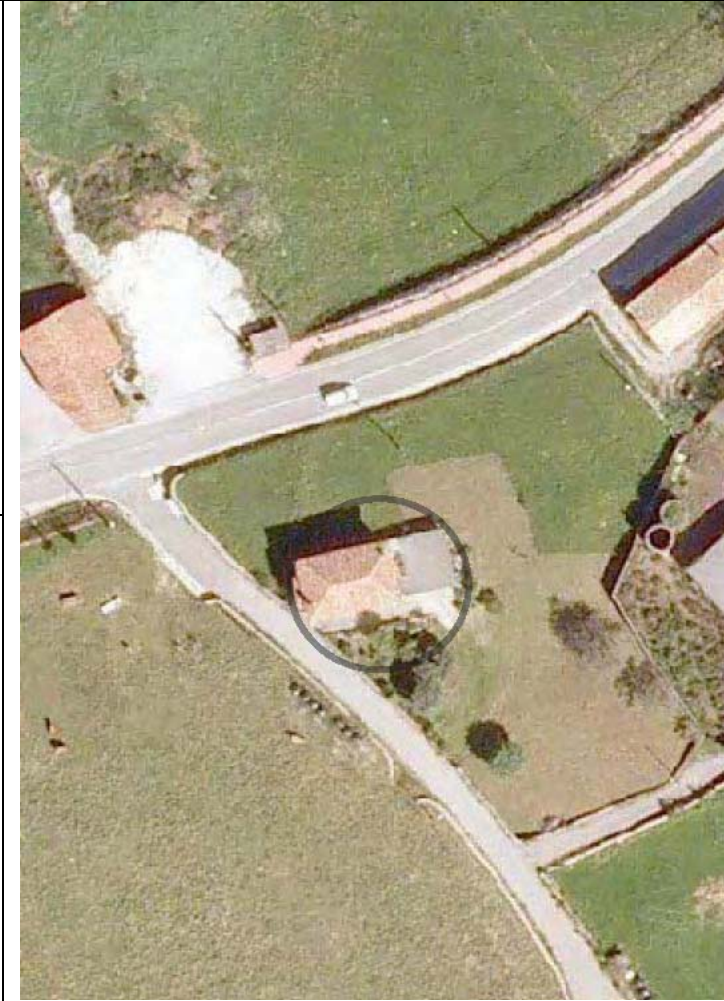
Plan Nacional de Ortofotografía Aérea ( PNOA 2007 ). E:1/1000