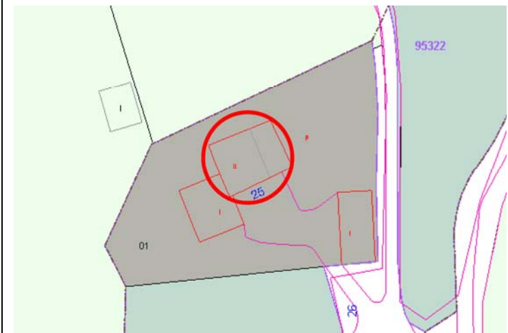
Plano de Catastro (Junio2010). E: 1/1000