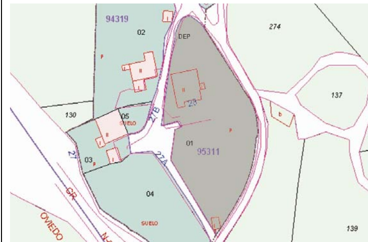
Plano de Catastro (Junio2010). E: 1/2000