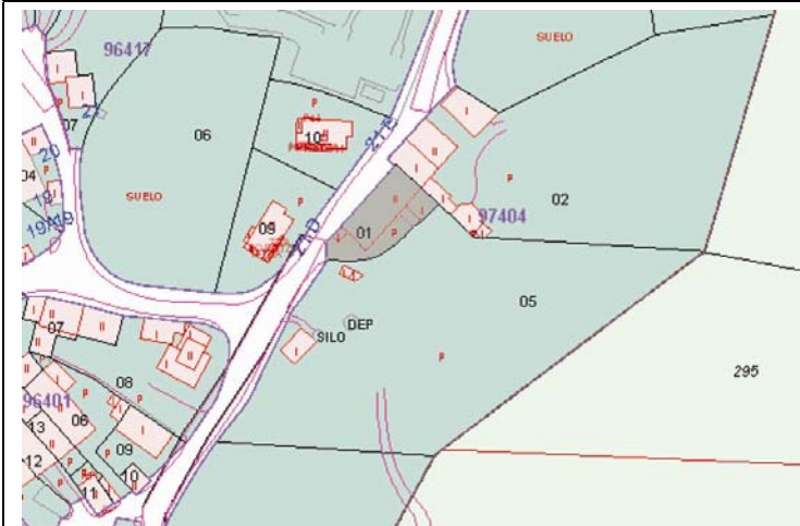
Plano de Catastro (Junio 2010). E: 1/2000