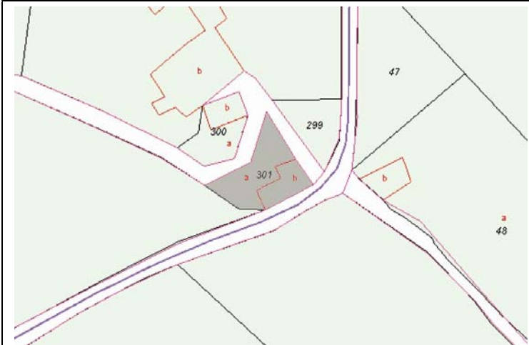
Plano de Catastro (Junio2010). E: 1/2000