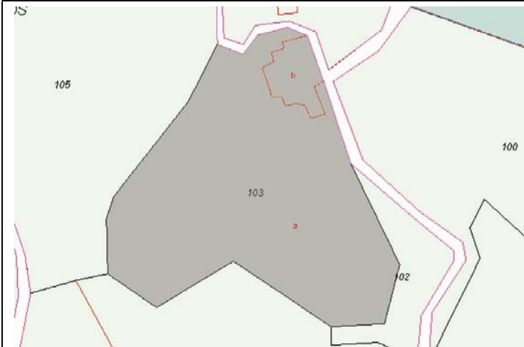
Plano de Catastro (Junio 2010). E: 1/2000