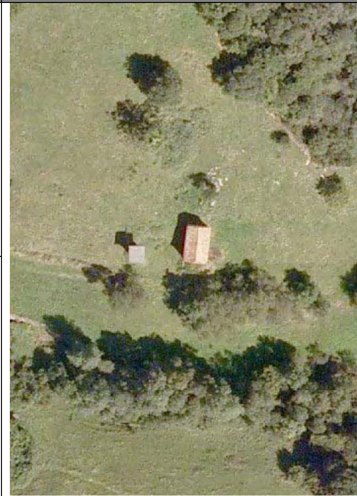
Plan Nacional de Ortofotografía Aérea ( PNOA 2007 ). E:1/1000