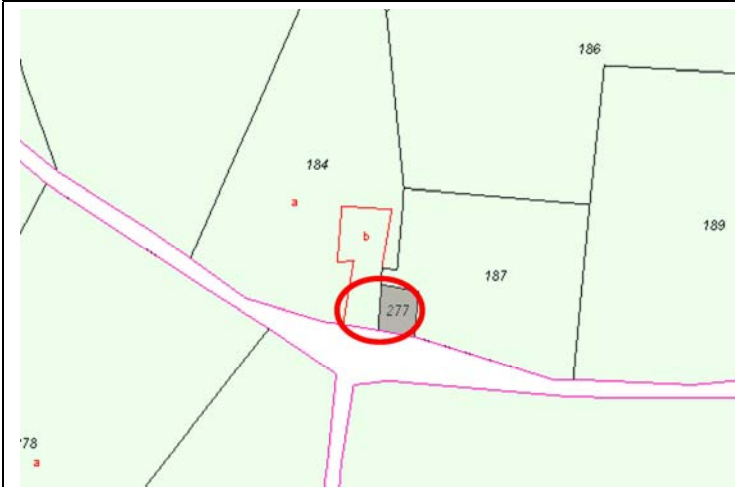
Plano de Catastro (Junio 2010). E: 1/2000