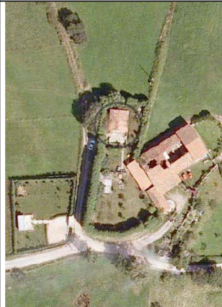
Plan Nacional de Ortofotografía Aérea (PNOA 2007). E:1/1000