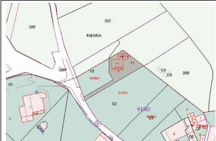
Plano de Catastro (Junio 2010). E: 1/2000