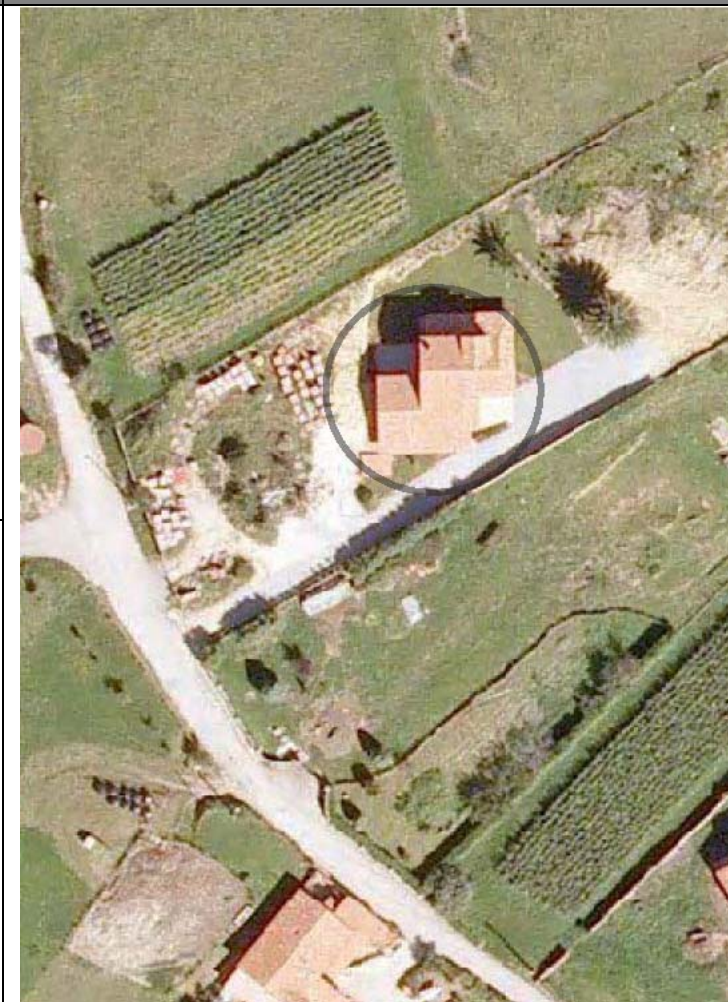
Plan Nacional de Ortofotografía Aérea (PNOA 2007). E:1/1000