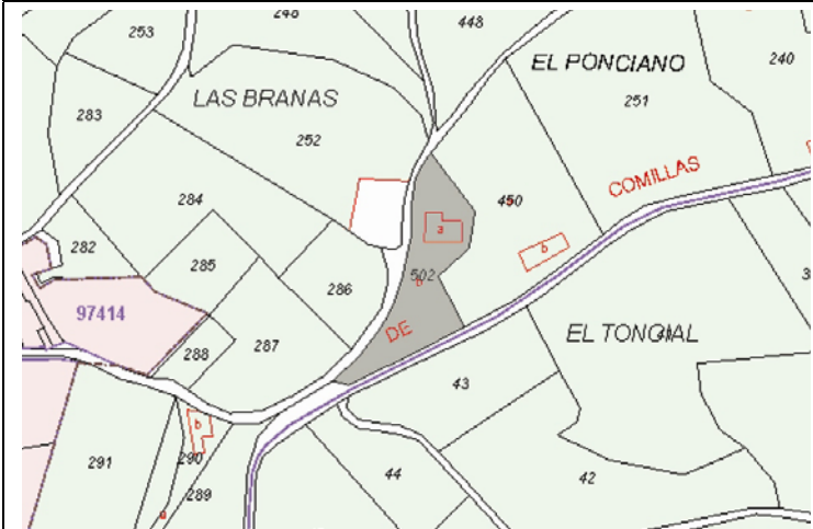
Plano de Catastro (Junio 2010). E: 1/5000