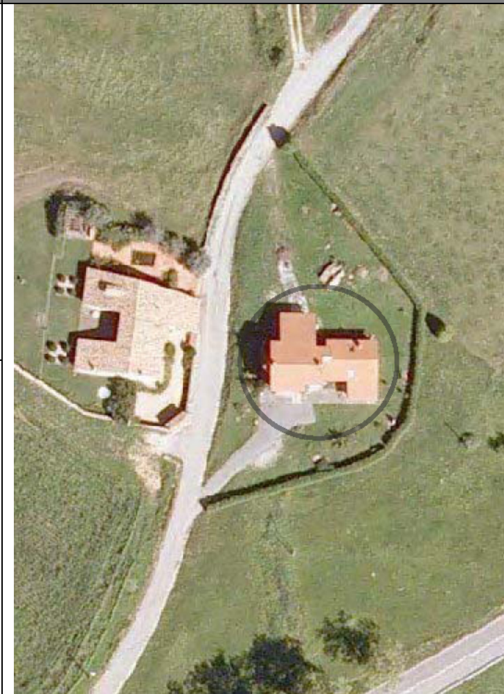
Plan Nacional de Ortofotografía Aérea ( PNOA 2007 ). E:1/1000