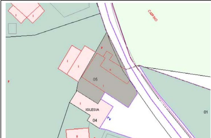
Plano de Catastro (Junio2010). E: 1/1000